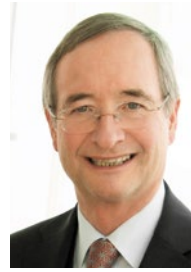
Dr. Christoph Leitl Präsident der Wirt- schaftskammer Österreich

... Pioniere ... Leidenschaft ... Motivation ... erfolgreicher gesellschaftlicher Wandel ... Innovation ... Start-ups ... Vernetzung ... Treiberin der Wissensgesellschaft ... hohes internationales Ansehen.