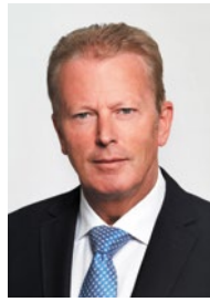
Dr. Reinhold Mitterlehner

Vizekanzler und Bundesminister für Wissenschaft, Forschung und Wirtschaft